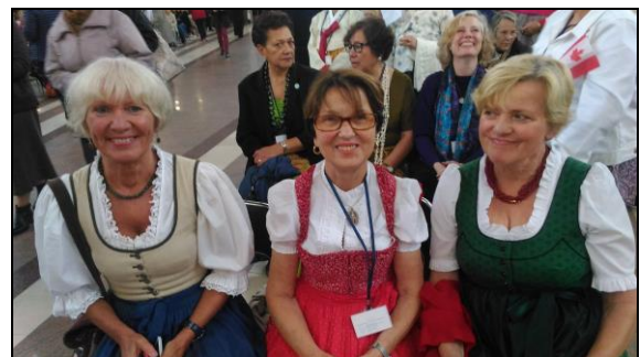
L'équipe autrichienne de la Prière des Mères

L'Archevêque nous a donné une homélie très émouvante dont nous partageons